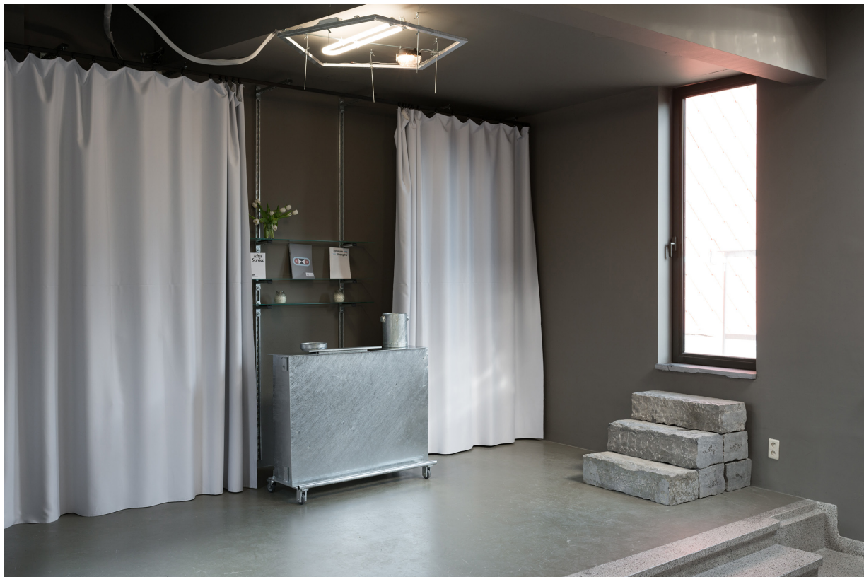
Tweede verdieping, 2017