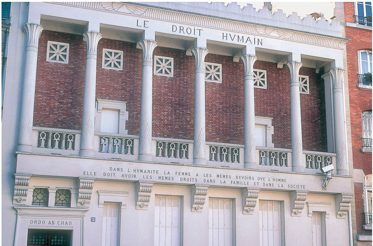
De tempel van Le Droit Humain in Parijs, 1912.